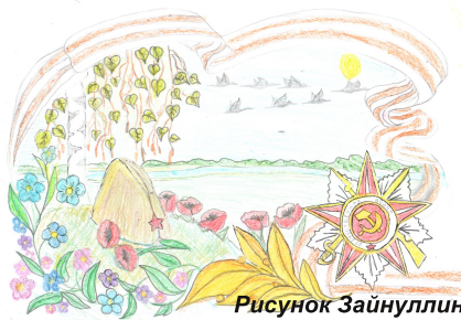
Рисунок Зайнуллиной Алии, 7 А класс